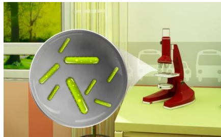
Mikroskopik canlılar ancak mikroskop ile görülebilir.

Etrafımızda çıplak gözle görülemeyecek kadar küçük pek çok canlı yaşar. Mikroskop ile görülebilen bu canlılara mikroskopik canlılar adı verilir. Mikroskopik canlılar; suda, havada, toprakta ve diğer canlıların üzerinde bulunur.